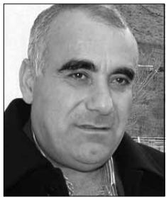
ԱԶՏԱ ՎԱՍՊՈՒՅԱՆ «Մեղրու ճՇՇ» ԲԲԸ փնտրեն

Ըստ մարզպետարանի տրամադրած «Այունյաց մարզի ճանապարհաշինարարական ձեռնարկությունների կողմից սպասարկվող ճանապարհահատվածների մասին» տեղեկանքի՝ «Ոսմար» ՄՊԸ-ն սպասարկում է 85.5կմ միջպետական (Գորիս-Սիսիան հատված-16.5, Գորիս-Կապան հատված (Չայգամի)-