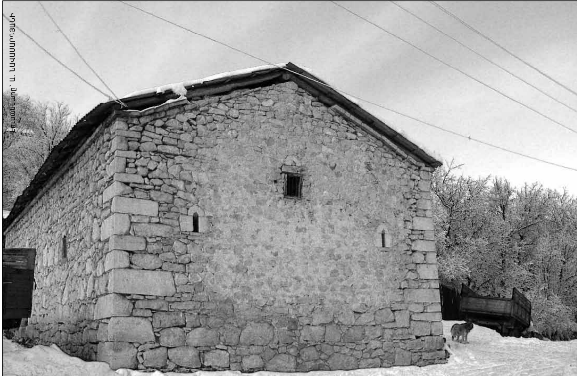
Ուժանիսի Սուրբ Զովհաննես եկեղեցին

ՊԱՏՄԱԿԱՆ ՏԵՂԵԿԱՆՔ Այունյաց մարզի Ուժանիս գյուղը գտնվում է Կապան մարզկենտրոնից 12 կմ հյուսիս-արևելք: Գտնվում է Մեծ Զայքի Սյունիք աշխարհի Բաղք-Քաջունիք գավառի մի մասը: Առաջին անգամ հիշատակվում է Ստ. Օրբելյանի մոտ Կաթունիք, ապա Գ. Ալիշանի մոտ՝ Կաթունիք, այնուհետև՝ Կաթունիս, Կաթունիս անուններով: Ուժանիսում է գտնվում Ա. Չովհաննես միանավ եկեղեցին՝ կառուցված 1873 թվականին: Այսպես էլ ոչ հեռու գտնվում են Զին Ուժանիս, Սպիտակ աղբյուր եւ Շենարեղ բնակավայրերը: Գյուղից 1 կմ հյուսիս-արևելք գտնվում է Զանգին արտ կոչվող վայրը, որտեղ ընդարձակ գերեզմանատեղի կա, իսկ վերջինիս կենտրոնում՝ գեղեցիկ զարդաքանդակներով մարտահաջաբար, որն այժմ գտնվում է կիսավեր վիճակում: Ուժանիսում հյուրընկալվել է Բաֆֆին, նրա վկայությամբ այս գյուղից է եղել Դավիթ-Քելի գինակից Տեր-Պատարարը՝ «Ալշար երեցը»: Խորհրդային տարիներին այստեղ գործել է նաև Աղասի Խանջյանի անունը կրող կուլտուրա-ստույունը, եւ ամենեւին էլ պատահական չէ, որ ներկայումս գյուղապետի աշխատասենյակում կախված է Աղասի Խանջյանի՝ վերջին նախնական «դոֆինի» (Եղիշե Չարենցի բնութագրմամբ) մեծադիր դիմանկարը: