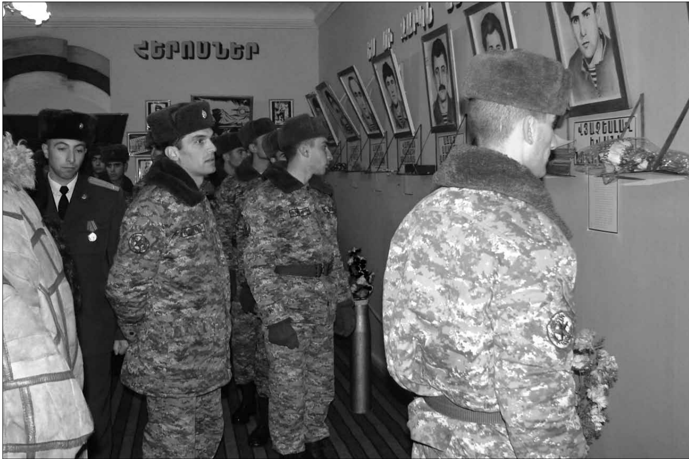
Ազգային բանակի մարտիկները ծանոթանում են մարտական փառքի սրահի ցուցանմուշներին: