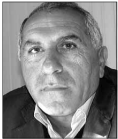
ՀՐՈՎ ԳԱՐՄԻՐԵՅԱՆ «Սիսիանի ճանշին» ՄՊԸ փնտրեն

40.5կմ, Գորիս-ԼՂՀ սահման-28.5կմ), 44.6կմ հանրապետական, 129.2կմ մարզային նշանակության ճանապարհներ: Ինչպես մեզ տեղեկաց-