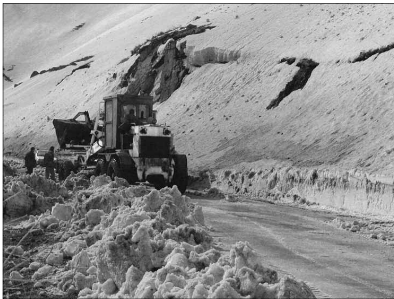
Ձմեռը Գիբազի լեռնանցքում

40.5կմ, Գորիս-ԼՂՀ սահման-28.5կմ), 44.6կմ հանրապետական, 129.2կմ մարզային նշանակության ճանապարհներ: Ինչպես մեզ տեղեկաց-