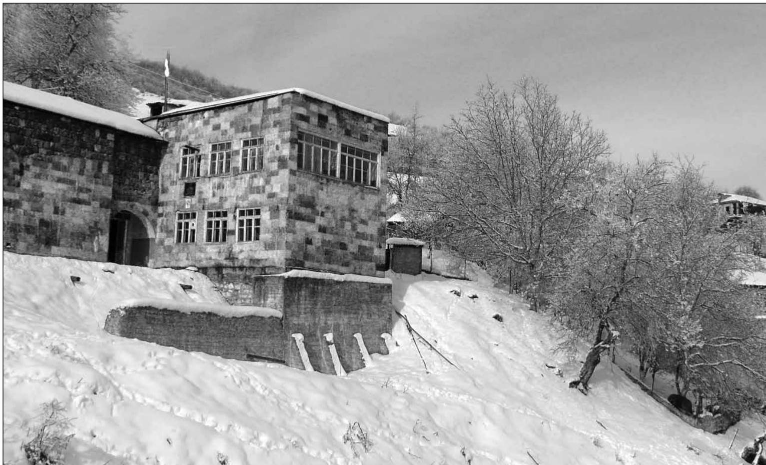
Նուստրոպոլիսի մ. Սանտաբարբառի

Եվ խոսք չի՝ բուննի այլևս այն երկրում, որով անցել է Աթիլի հին ձին... ԵՂԻՇԵ ՉԱՐԵՆՑ